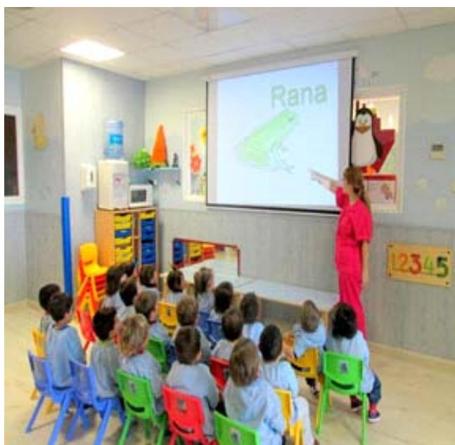
Contribución de: Licda. Morena Lemus Posada Docente del ITU

La inmersión de la tecnología en el salón de clase permite el uso de recursos y herramientas interactivas, y que mantienen la atención de los estudiantes con más facilidad y por más tiempo. Además, ayuda a que los estudiantes se sienten en un ambiente de aprendizaje más productivo. La utilización de videos le permite aprender de manera más rápida, las redes sociales y la Web 2.0 les permite compartir diferentes puntos de vista y debatir sobre las ideas, lo que ayuda a que los niños y adolescentes desarrollen un pensamiento crítico en tal sentido de que sus cerebros se mantengan más activos. Por otra parte, los profesores pueden beneficiarse mucho de los avances tecnológicos para hacer su trabajo más atractivo y para ser más eficientes. Muchas actividades de las que forman parte de su rutina diaria se pueden optimizar con la ayuda de aplicaciones y dispositivos informáticos, permitiendo que puedan dedicar más tiempo a su propia formación, lo que a largo plazo no solo les beneficiará a ellos sino a sus estudiantes.